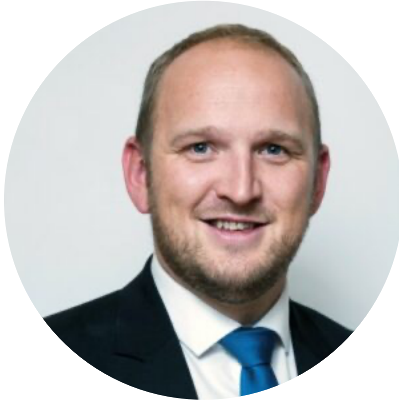
Jon Georg Dale Samferdselsminister